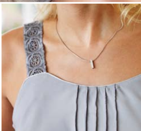
Miedertop mit reizvollen Overlock-Biesen und gestickten Trägern.