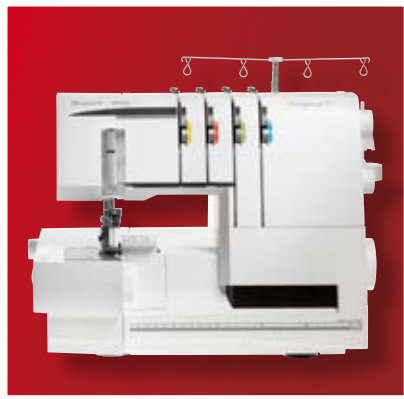
Die HUSKYLOCK™ s21 verfügt über 21 Stiche.