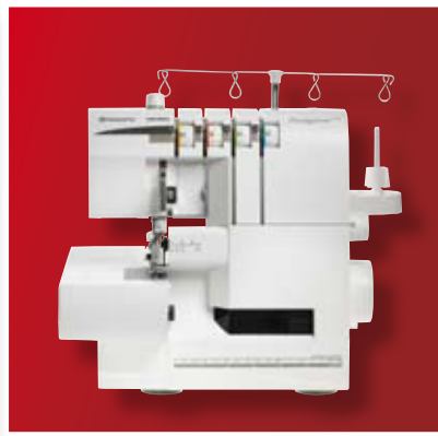
Die HUSKYLOCK™ s15 verfügt über 15 Stiche.