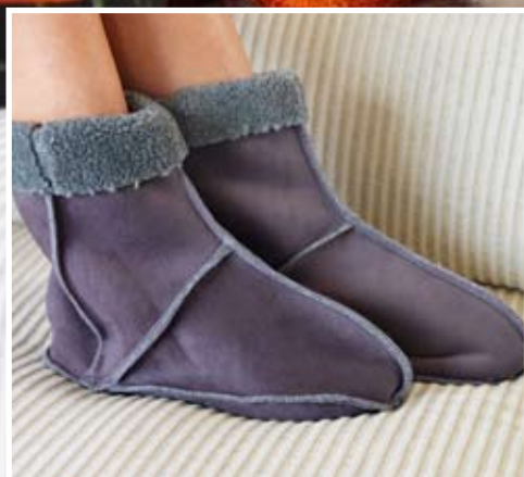
Kuschelige Hausschuhe mit Overlock-Stichen veredelt.