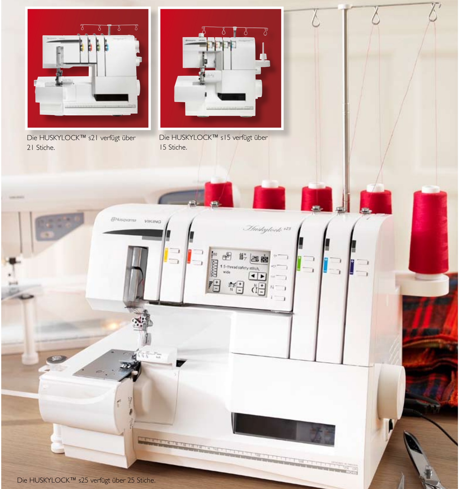
Die HUSKYLOCK™ s25 verfügt über 25 Stiche.

Ein Traum sind die wundervollen Heimdeko-Projekte und die zauberhafte Bluse mit dem edlen Top auf den folgenden Seiten. Ein Traum sind auch die Overlockmaschinen HUSKYLOCK™: innovativ und komfortabel in der Bedienung. Gestalten Sie einzigartige Ideen. Sie werden staunen, was Sie alles mit einer Overlock zaubern können. Für jeden Anspruch die Richtige! Ganz gleich ob Anfänger oder Profi, die Overlocks von HUSQVARNA VIKING® haben für jeden das passende Modell.