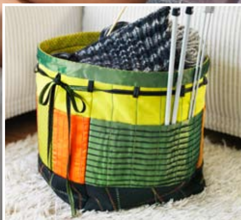
Attraktiver Nähkorb mit dekorativen Overlockstichen und Seitentaschen für Nadeln, Wolle oder Nähzubehör.