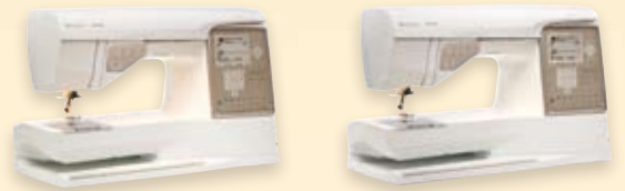
DESIGNER TOPAZ™ 30 DESIGNER TOPAZ™ 20