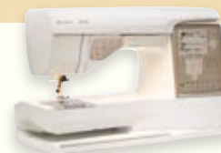
DESIGNER TOPAZ™ 30