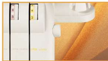
Fadenspannungslüfter: Einfaches Lösen der Fadenspannung