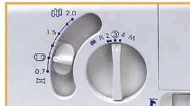
Einfaches Einstellen der Stichlänge und des Differenzialtransports!