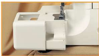
Freiarm: Rundnähen ist ein Kinderspiel

Eine Overlockmaschine - Viele Möglichkeiten und Vorzüge!