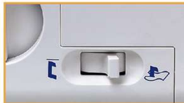
Müheloses Versenken des Messers mittels Schalter!