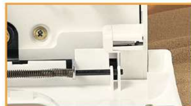
Sicherheitsschalter für geöffneten Frontdeckel