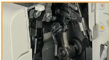
Untergreifereinfachhilfe- ruck-zuck einfach ein!