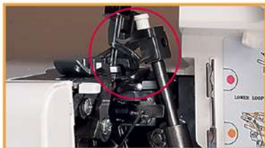
2-Faden-Nähen – mit Adapter möglich!