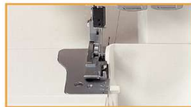
Eingebauter Rollsaum: Rollsaumnähen ohne Stichplattenumbau